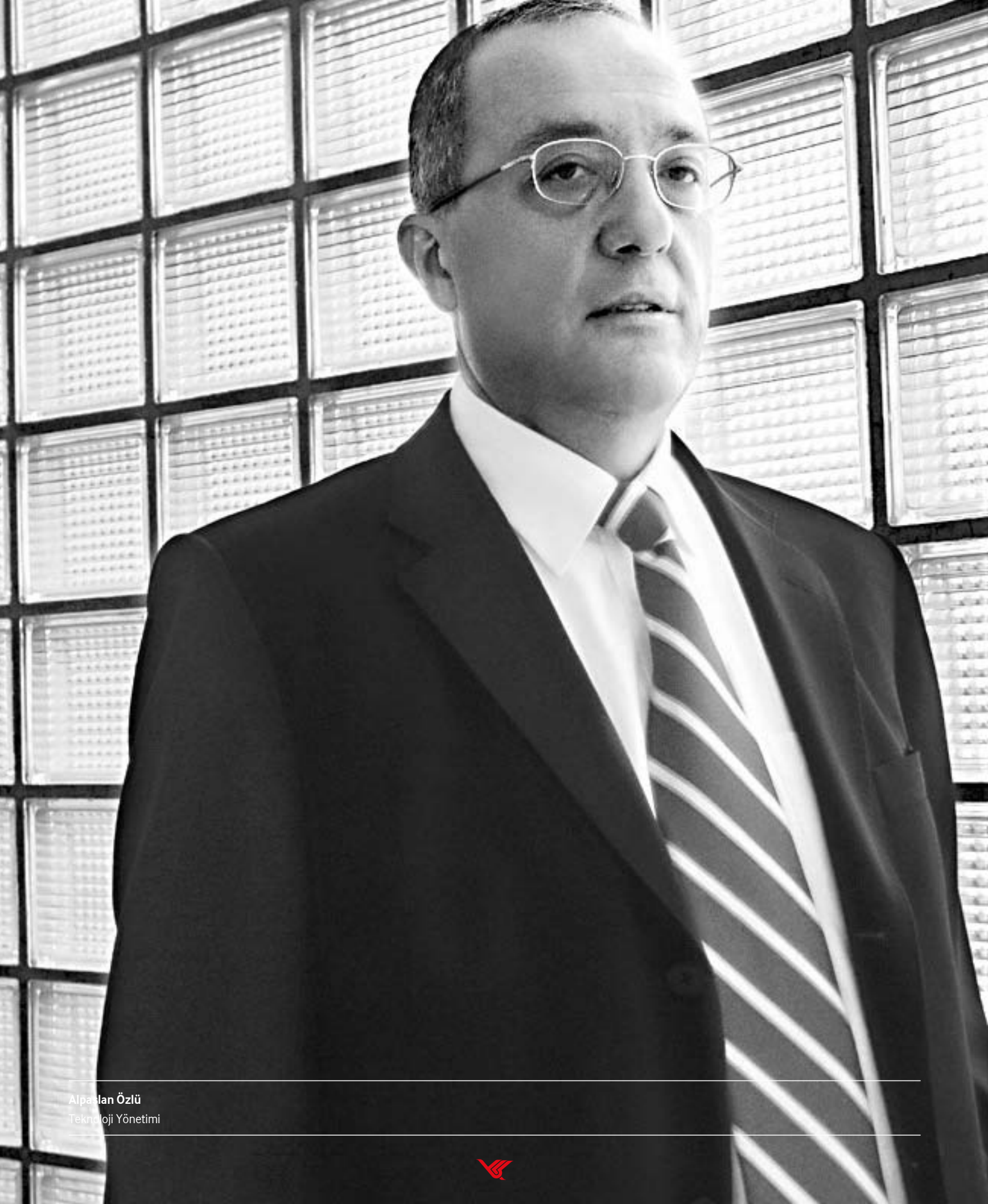
Alpakan Özlü Teknoloji Yönetimi