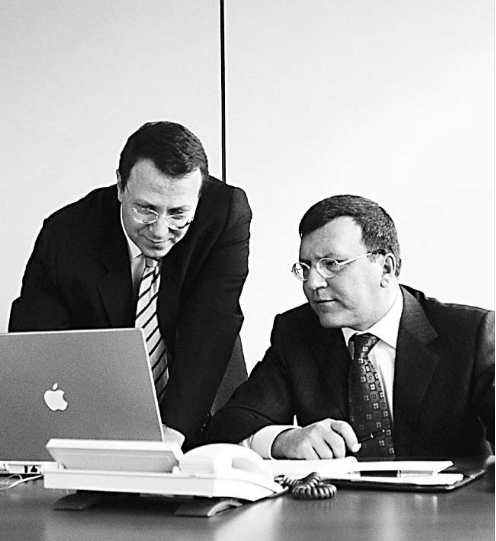
Reha Yolalan Finansal Analiz ve Risk Yönetimi