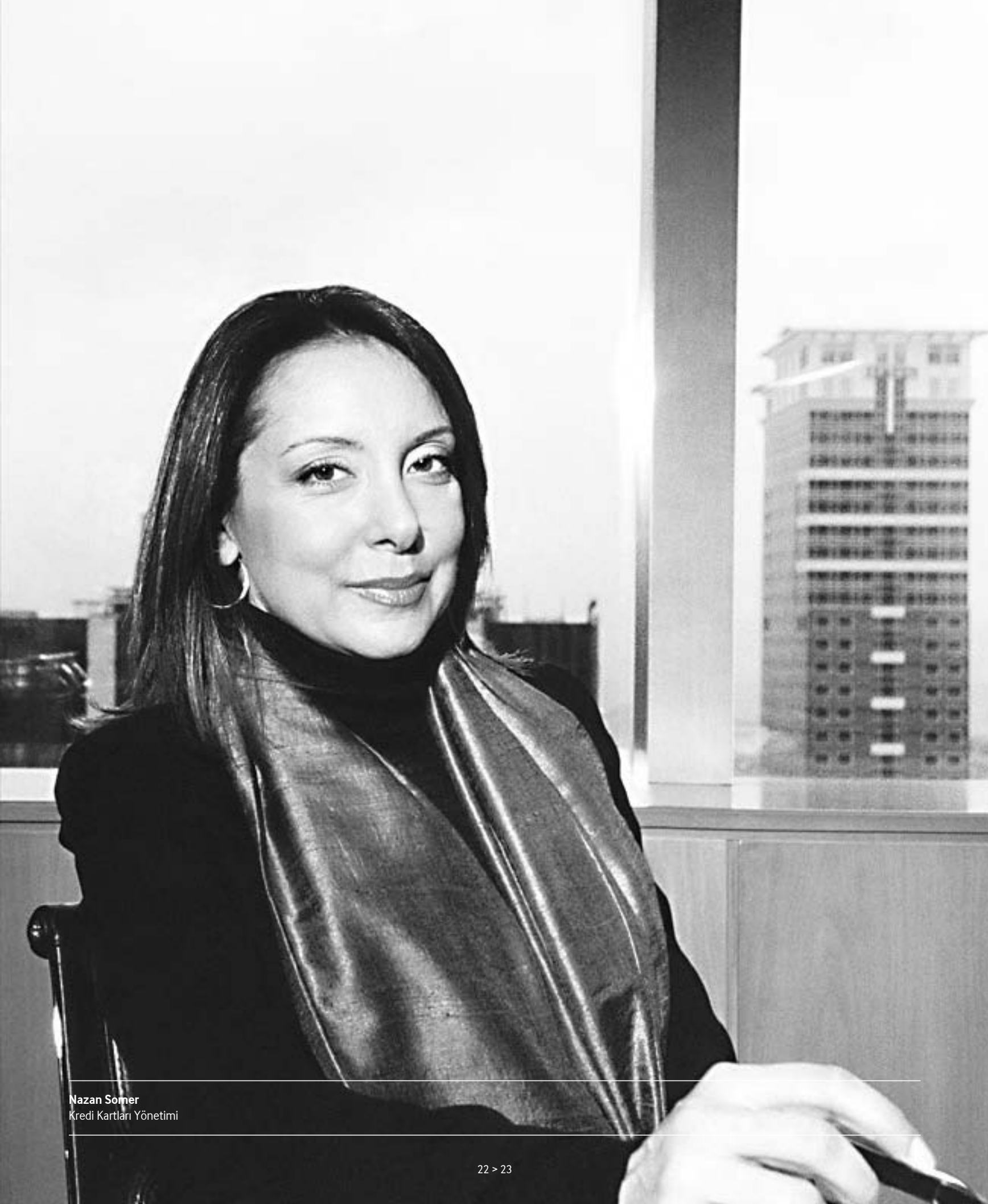
Nazan Somer Kredi Kartları Yönetimi