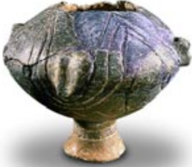
Kap, Troia I, MÖ 3. binyıl, pişmiş toprak Dört tarafı ip delik tutamaklı olan bu kap yiyeceklerin asılarak saklandığına işaret eder. Çanakkale Arkeoloji Müzesi Env. No: 4357, çap: 12,5 cm.

esprili tonu ve her yaşta ki gençleri kavrayan müzik kullanımı ile "Gençlik Bankacılığı" kampanyası sadece bu alandaki ürünlerin satışına katkı sağlamakla kalmamış, Yapı Kredi'nin yenilikçi ve öncü imajını da desteklemiştir.