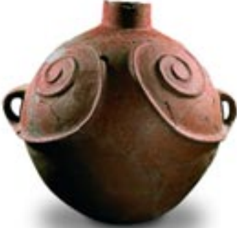
Spiralli Çömlek, Troia III, MÖ 2250-2200, pişmiş toprak Depolama amaçlı kullanılan büyük formların bile incelikle işlenmiş olduğu görülür. Ege adalarında da bilinen spiralli kaplar zariflik sembolüdür. Çanakkale Arkeoloji Müzesi Env. No: 8596, çap: 40 cm.

Kredi kartı pazarında artan rekabet Teknoloji Yönetimi'ni yeni ürünler geliştirmeye ve hızla uygulamaya almaya teşvik etmiştir. Eurobond gibi yeni yatırım araçlarına artan talep, bu tür ürünleri desteklemek için yeni yazılım ürünlerinin hazırlanmasını gerekli kılmış ve bu yönde yapılan çalışmalar yıl içinde tamamlanmıştır. Bankamız iştiraklerine de destek verilmesi yönündeki karar doğrultusunda Teknoloji Yönetimi 2002 yılı içinde yeniden yapılanmıştır. Yazılım ve teknik becerilerin ön plana çıkarılması hedefiyle beceri grupları işlevsellik, teknoloji platformu ve uygulama mimarisi gözetilerek organize olmuşlardır. Teknoloji Yönetimi bünyesinde finansal kuruluşların tüm gereksinimlerini karşılayabilecek beceri merkezleri bulunmaktadır.