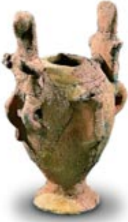
Figürinli kap, Troia II, MÖ 2550-2350, pişmiş toprak Çanakkale Arkeoloji Müzesi Env. No: 8734, h: 12 cm.