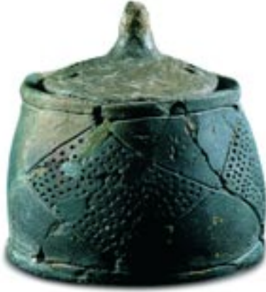
Pyksis Kutucuk ve kapağı, Toia I, MÖ 2920-2550, pişmiş toprak Üzerleri genelde çizgi bezemeli ve kapaklı kutucuklar döneminin sevilen formları arasındadır.

Çanakkale Arkeoloji Müzesi Env. No: 224 ve 209, çap: 7,3 cm.