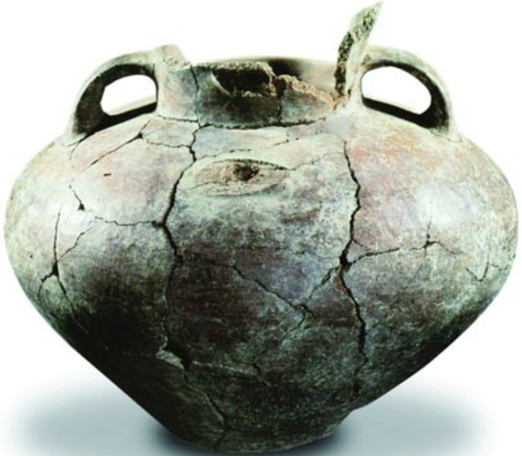
Amphora, Kumtepe B, MÖ 4. binyılın ikinci yarısı, pişmiş toprak Kumtepe B ve C dönemlerinde ölen bebekler günlük hayatta kullanılan kaplara konularak ev ve işliklerin içine gömülüyorlardı. Duvarların arasında ezilmiş bir halde bulunan bu amphorada bir bebek gömüsü bulunmuştur. Çanakkale Arkeoloji Müzesi Env. No: 9107, çap: 30,5 cm.