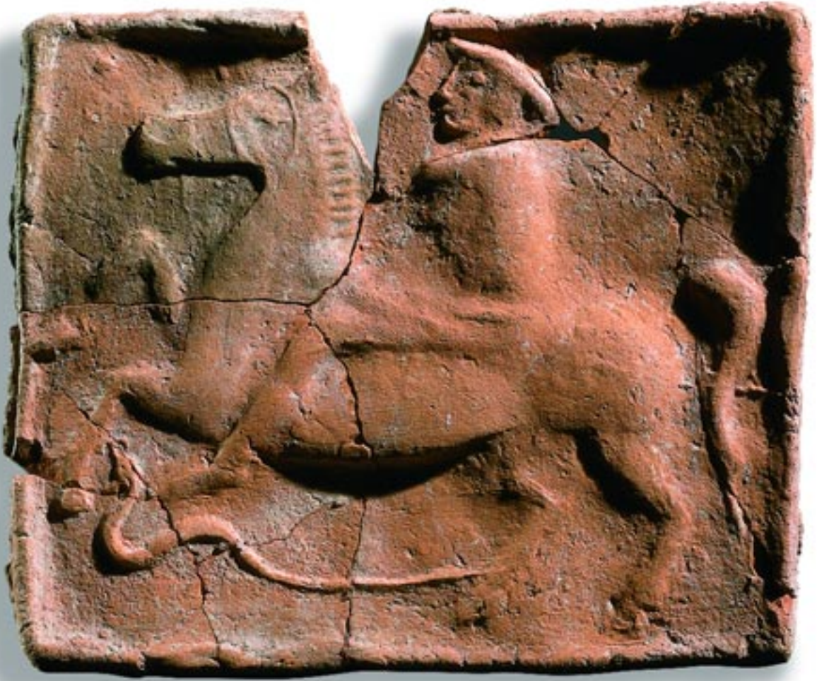
Batı Tapınağı'ndaki süvari plakası