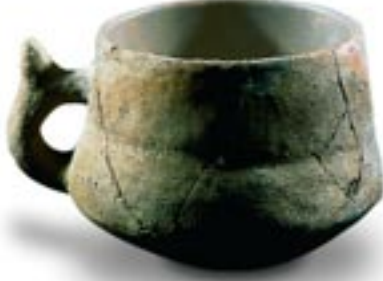
Fincan, Kumtepe A, MÖ 6. binyıl sonu 5. binyıl başı, pişmiş toprak Keramikteki yaratıcılık ve sanatsal beceri, bölgenin tüm yerleşim süresi içinde kendisini en iyi erken devirlerde gösterir. Çanakkale Arkeoloji Müzesi Env. No: 7716, çap: 10,8 cm.

bankalarından temel beklentileri yakınlık ve yerel gereksinimlerine uygun hizmet almak olan ticari ve küçük işletme müşterilerine üstün kalitede hizmetler sunmaktadır.