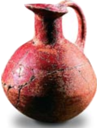
Testi, Kumtepe C, MÖ 3. binyıl, pişmiş toprak Anadolu'da aşağı yukarı aynı dönemde yaygınlaşan ve zamanla daha da keskin uzun bir form alan gaga ağzların ilk örneklerindedir. Çanakkale Arkeoloji Müzesi Env. No: 7258

2002 yılında konsolide bütçe gelirleri reel olarak %1,8 azalırken, bütçe harcamalarında %4,3'lük reel bir düşüş gerçekleşmiştir. Harcamalardaki bu düşüş esas olarak faiz harcamalarındaki %15,9'luk reel azalmadan kaynaklanmıştır. 2002 yılında faiz dışı harcamalarda ise %7,8'lik bir reel artış olmuştur. Bu gelişmeler sonucunda 2002 yılında konsolide bütçe açığı 39,1 katrilyon TL olurken, faiz dışı bütçe dengesi 12,8 katrilyon TL fazla vermiştir. Ancak bu rakam 15,9 katrilyon TL tutarındaki faiz dışı fazla hedefinin altında kalmıştır.