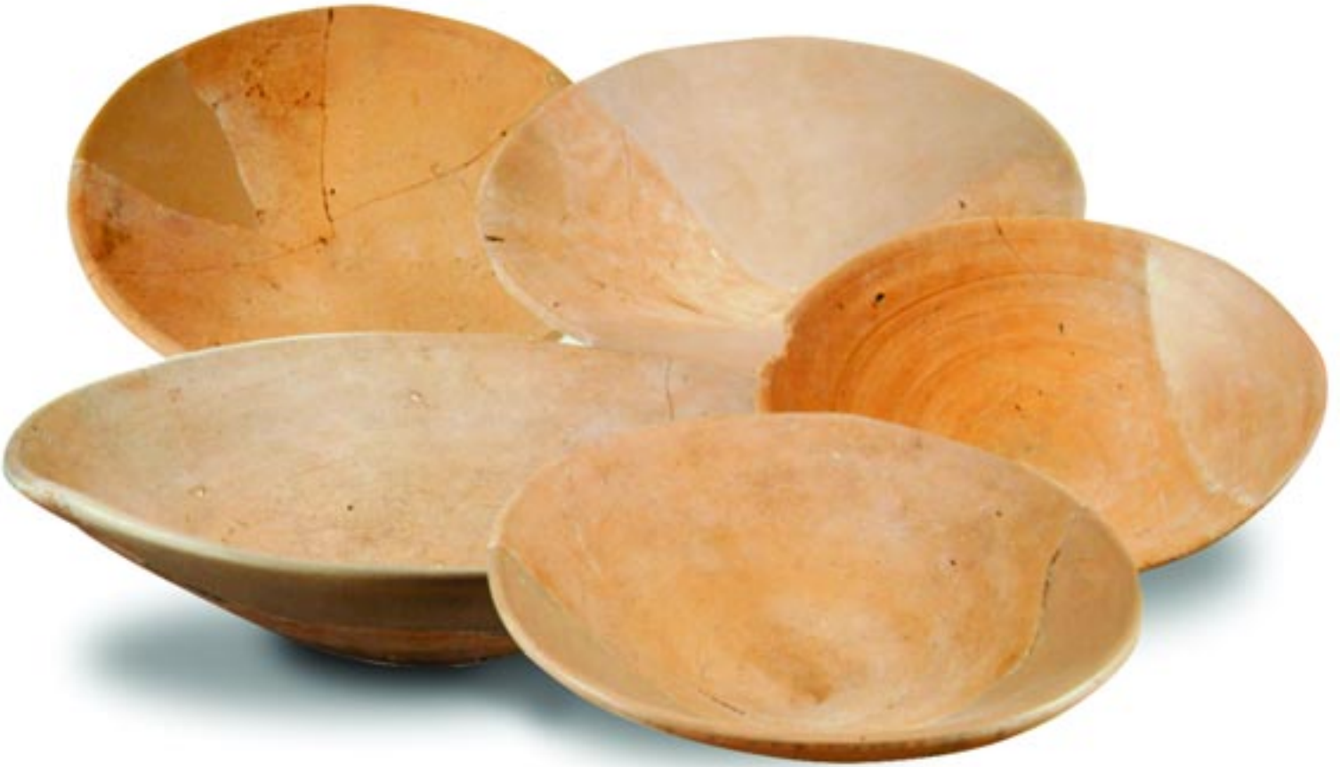
Tabaklar, Troia II, MÖ 2550-2350, pişmiş toprak Çömlekçi çarkıyla birlikte ortaya çıkan ve seri olarak üretilen tabaklar dönemin en yeni ve en sevilen formudur. Çanakkale Arkeoloji Müzesi Env. No: 8872/8909/8873/8910/8048, çap: 16,5-25 cm.