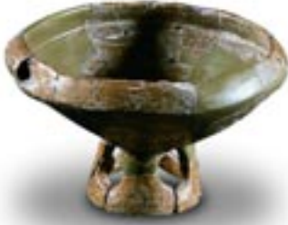
Meyvalık, Troia I, MÖ 2920-2550, pişmiş toprak Ayaklarında açılmış olan pencereler bu dönemin tipik özelliklerindedir. İstanbul Arkeoloji Müzeleri Env. No: 36.840, çap: 17,8 cm.

teşkil etmiştir. 2002 yılında şube çalışanlarının performans değerlendirmelerinde yıllık olarak rakamsal sonuçlar, beceriler ve ortak değerler ölçülmüş; Genel Müdürlük değerlendirmeleri de şubelerimiz için kullanılan yapıyla uyumlu hale getirilmiş, değerlendirmeler hedefler, beceriler ve ortak değerlerden oluşturulmuştur.