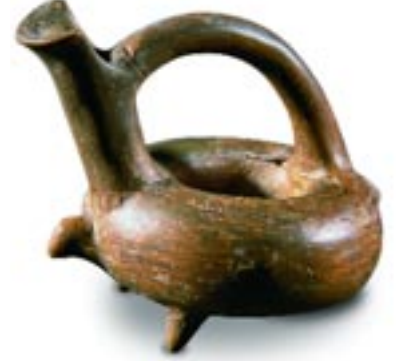
Kernos, Troia II, MÖ 2550-2350, pişmiş toprak Kiklat Adaları'nda sık görülen ve Kernos adı verilen bu tip ördek biçimli kaplar özel formlar arasındadır.

Istanbul Arkeoloji Müzeleri Env. No: 35.441, h: 9,2 cm.