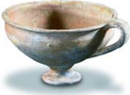
Goblet, Troia VI-VII, MÖ 1700-1200, pişmiş toprak İstanbul Arkeoloji Müzeleri Env. No: 34.268, çap: 12,4 cm.

reklamcılık, pazarlama, servis sağlama, yatırım ve organizasyon alanlarında faaliyet gösteren ve hizmet veren, kurulmuş veya kurulacak yerli veya yabancı şirketler, kurumlar, halka açık olan veya olmayan özel teşebbüs kuruluşlarının sermaye ve yönetimine iştirak etmek